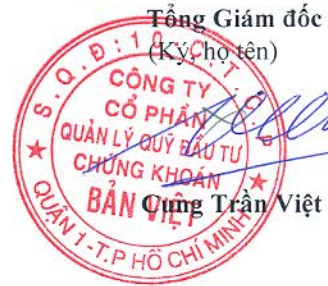
Công Trần Việt