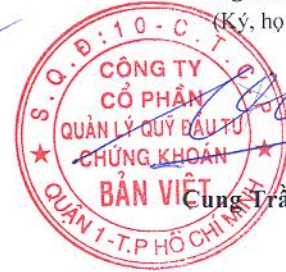
Cung Trần Việt