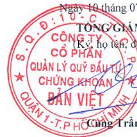
Cùng Trần Việt